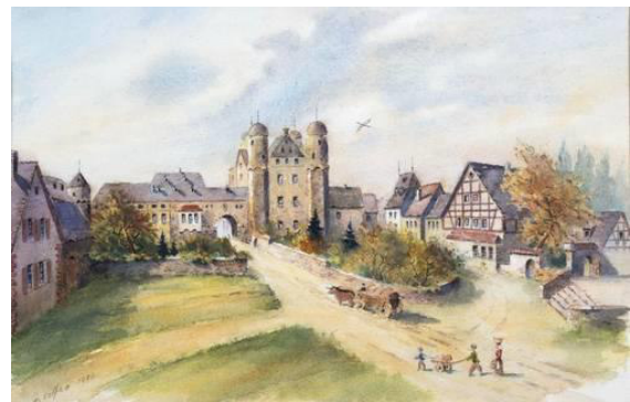
18. Jh., die schlossartig umgebaute Laurenziburg. 17