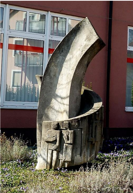
1964, Brunnen "Alte Pforte" an der Alten Landstraße.