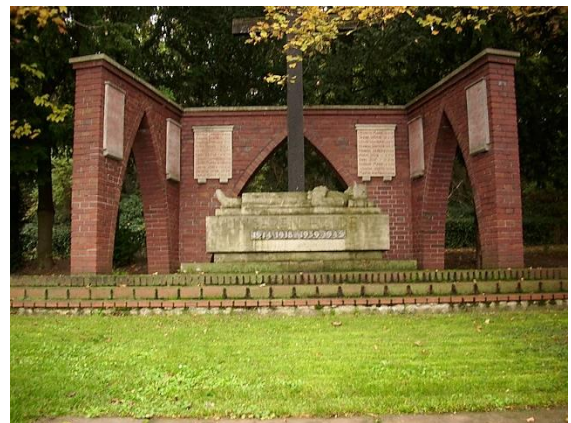
Kriegerdenkmal 1914/18, Sörgenloch, 1932. 3