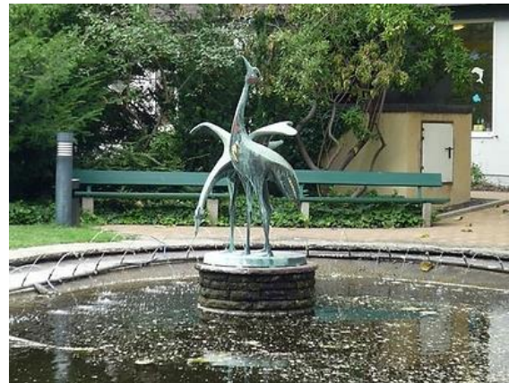
Kraniche, städt. Altersheim Mainz.1957. 8