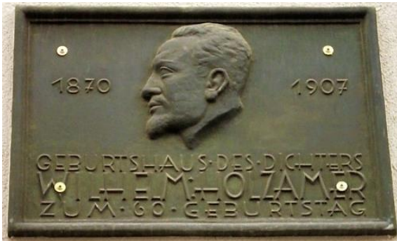
Gedenktafel am Geburtshaus für Wilhelm Holzamer, Pariser Straße 113.