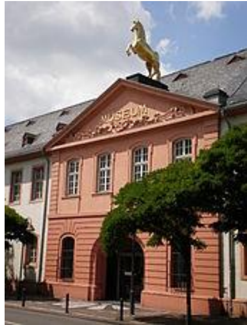
Golden-Ross-Kaserne, Rossfigur. 7