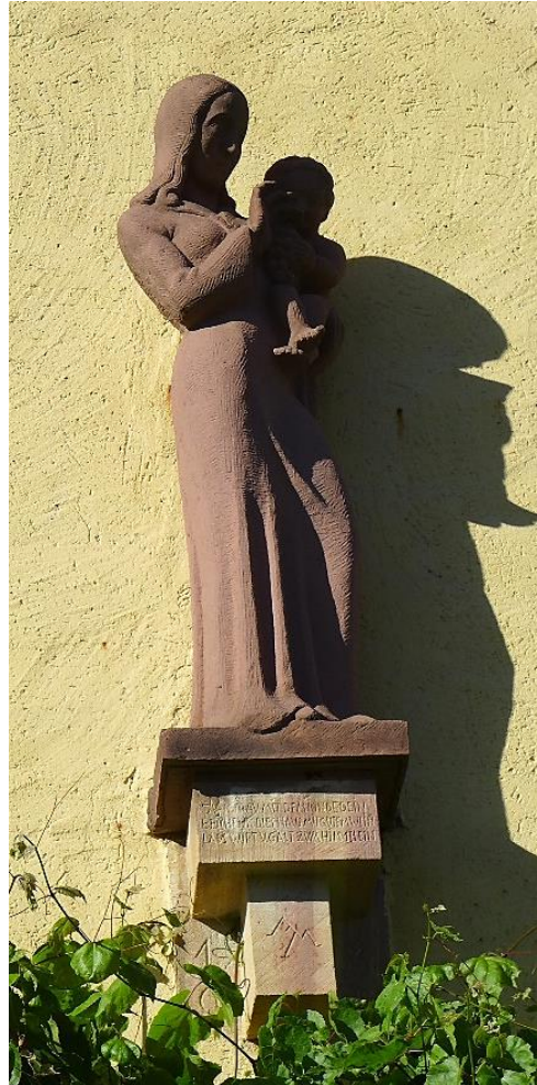
1931, Madonna am Haus Metten, Pariser Straße 41.