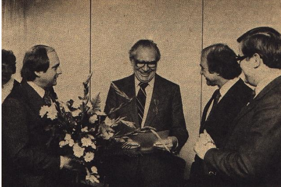
1978, Verleihung des Bundesverdienstkreuzes. 2

auch die "Diskussionsgruppe" an der 1977 errichteten Hauptschule, heute IGS-Wilhelm-Holzamer-Schule, erinnert. 1978 erhielt er für sein Lebenswerk das Bundesverdienstkreuz am Bande.