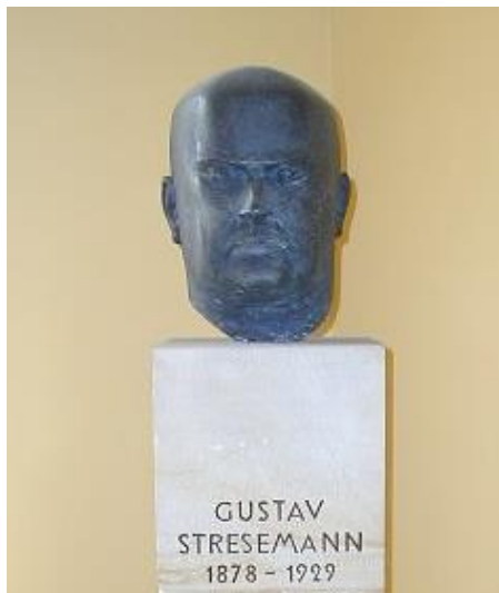
Gustav Stresemann, Mainz, Domus Universitatis. 5