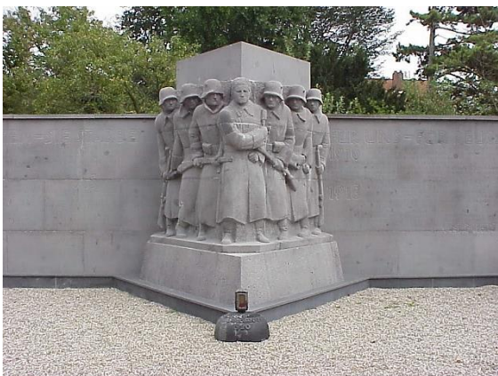
1937, Friedhof, Kriegerdenkmal 1914-1918.