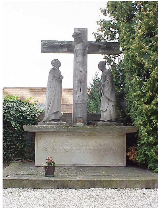
1936, Friedhof, Kreuzigungsgruppe.