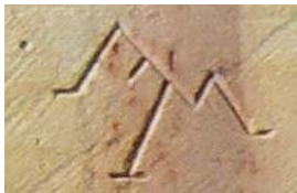
Steinmetzzeichen von Heinz Müller-Olm.