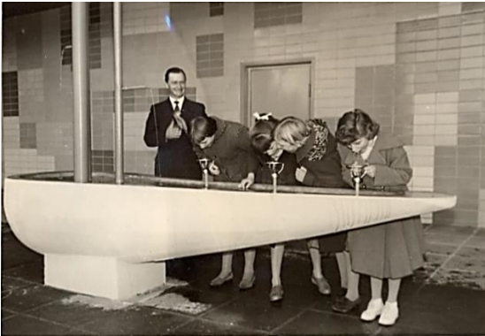
1959, Wasserbrunnen, Neubau Pausenhalle Burgschule.