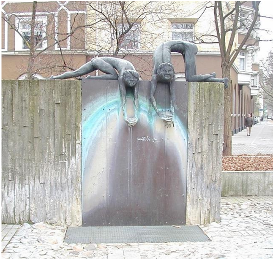
Meenzer Buwe, Bismarckplatz. 4