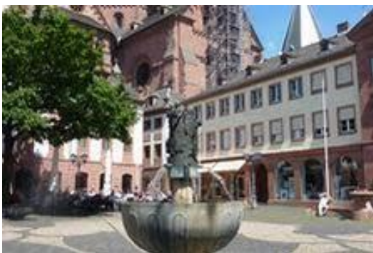
1980, Mainz, Leichhof, Bauherrenbrunnen. 6