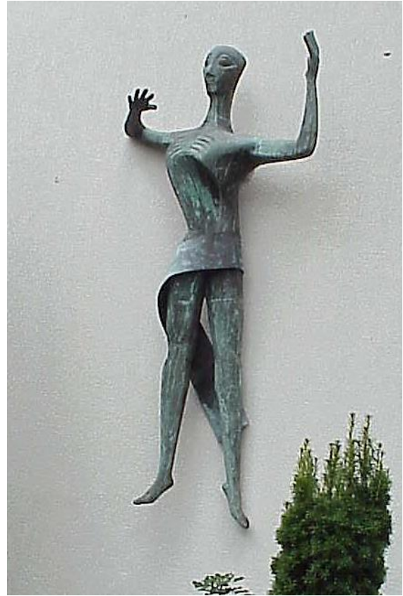
1957, Auferstandener, Friedhofskapelle.