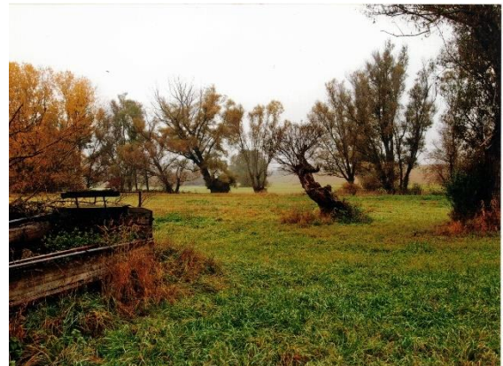
"In der Ochsenwiese" unweit der Eulenmühle 5