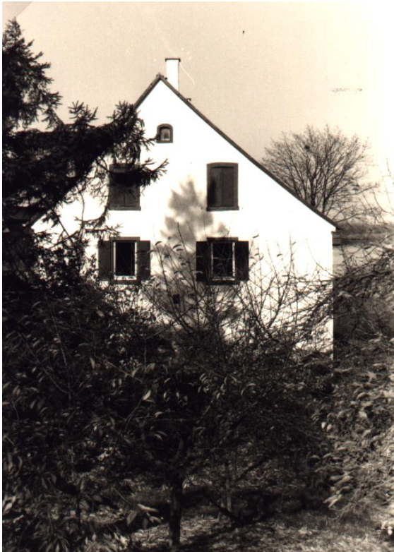
1979, die Eulenmühle, Blick von Nordosten. 3

Aufziehender Nebel erschwert zu allem Übel der Korporalschaft die Suche. Dann ist es mit einem Mal still. Angestrengt horchen die Grenadiere in die Dunkelheit hinein: Nichts! Kein Marschschritt, kein Hufgetrappel. Kein Ton. Tiefe Stille hüllt sie ein. Der Korporal streicht sich über den Schnauzbart und beißt sich in die Lippe: Er sieht seinen Kriegsruhm verschwinden, den er sich schon in den prächtigsten Farben ausgemalt hat. Nun hat auch er die Orientierung verloren. Doch das gibt er nicht zu. Und so geht die Suche weiter. Bis zum Morgen irren die Franzosen in der Winterlandschaft. Als es hell wird und der Nebel aufsteigt wollen sie nicht mehr zur Mühle zurückkehren – da könnte ja der Feind sitzen.