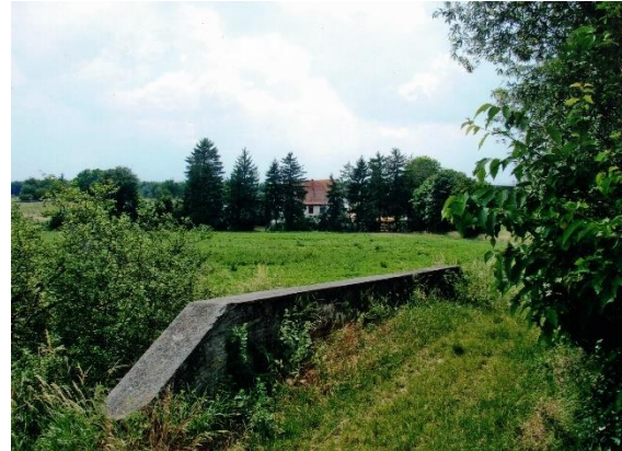
"An den Communwiesen" nahe der Eulenmühle. 4

Im darauffolgenden Jahr - Friede war geschlossen und Rheinhessen ein Teil Frankreichs geworden - fand die Hochzeit statt und später erzählte das junge Müllerpaar oft ihren Kindern die Geschichte von den Trompeten in der Nacht.