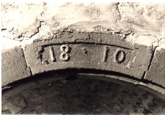
1810, Eulenmühle, Neubau der Scheune. 1

Hat er doch schon öfters Einquartierungen hinnehmen müssen. Seine Frau und seine Tochter tragen das Essen auf, nur die feinsten Speisen werden geduldet, und er muss immer wieder in den Keller hinabsteigen, um die Kanne mit Wein zu füllen. Bald sind die Grenadiere guter Stimmung und werden immer ausgelassener.